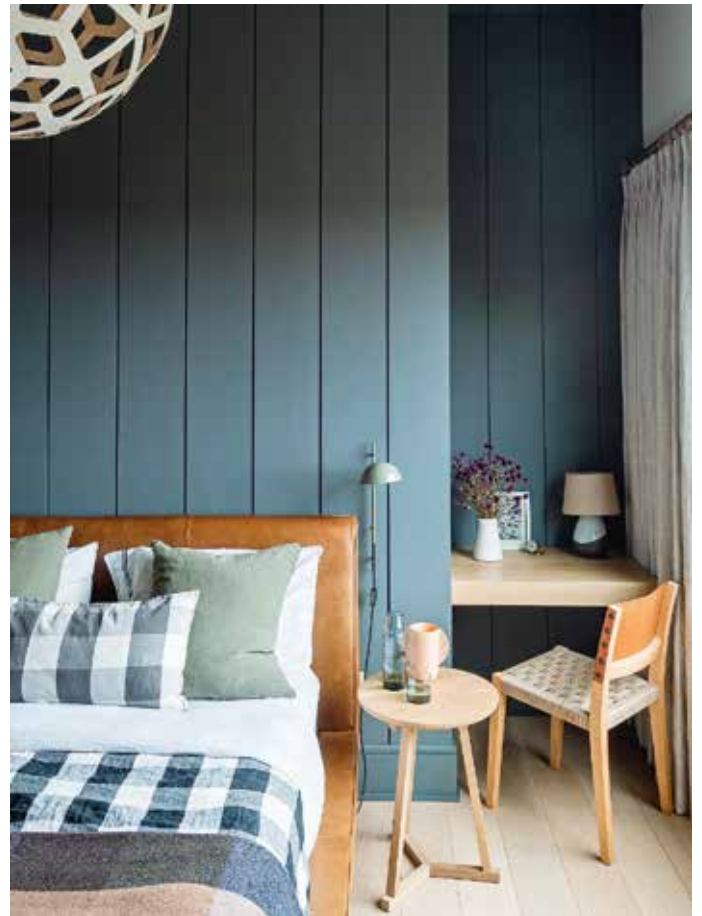
Die Autorin führt in diesem einzigartigen Wohnbuch durch verschiedene Stile, Trends und Zukunftsaussichten rund um das Thema Wohnen.

Alle, die auf der Suche nach ihrem ureigenen Wohnstil sind, finden hier genau die Anregungen, die nötig sind, um den ganz eigenen Mix für sich zu entdecken. Nach Durchsicht des Buches hat man einen sehr guten Überblick darüber, welche Möglichkeiten bestehen – auch unter eingeschränkten Gegebenheiten und mit begrenztem Budget – eine individuelle Wohnwelt zu schaffen. Dabei empfiehlt die Autorin in einem ersten Schritt die eigenen Wohnbedürfnisse zu analysieren, um darauf aufzubauen. Dafür bietet sie einen Überblick über die vielen möglichen unterschiedlichen Stile und deren Besonderheiten. Dann führt sie den Leser Raum für Raum durch die Wohnung und gibt am Ende jedes Kapitels ganz praktische Tipps. Im Kapitel über das perfekte Homeoffice schaut das dann so aus, dass der Leser zuerst dafür sensibilisiert wird wie man die Arbeitsatmosphäre schaffen kann, danach kommen ganz konkrete Entscheidungshilfen auf der Suche nach dem geeigneten Platz und schließlich wird sich den einzelnen Gegenständen des Homeoffice gewidmet. So entwickelt die Autorin Schritt für Schritt eine Reflexionshilfe und Anleitung bei der ganz persönlichen Gestaltung der Räume. Die Autorin Ute Laatz ist bekannt für ihre Arbeiten im Bereich Interior und Lifestyle. Mit vielen Wohnreportagen und Einrichtungsberatungen konnte sie ihre Leserschaft überzeugen und schafft hier ein neues Gesamtwerk. Als Fazit darf gesagt werden: das derzeit wohl schönste Wohnbuch auf dem Markt.