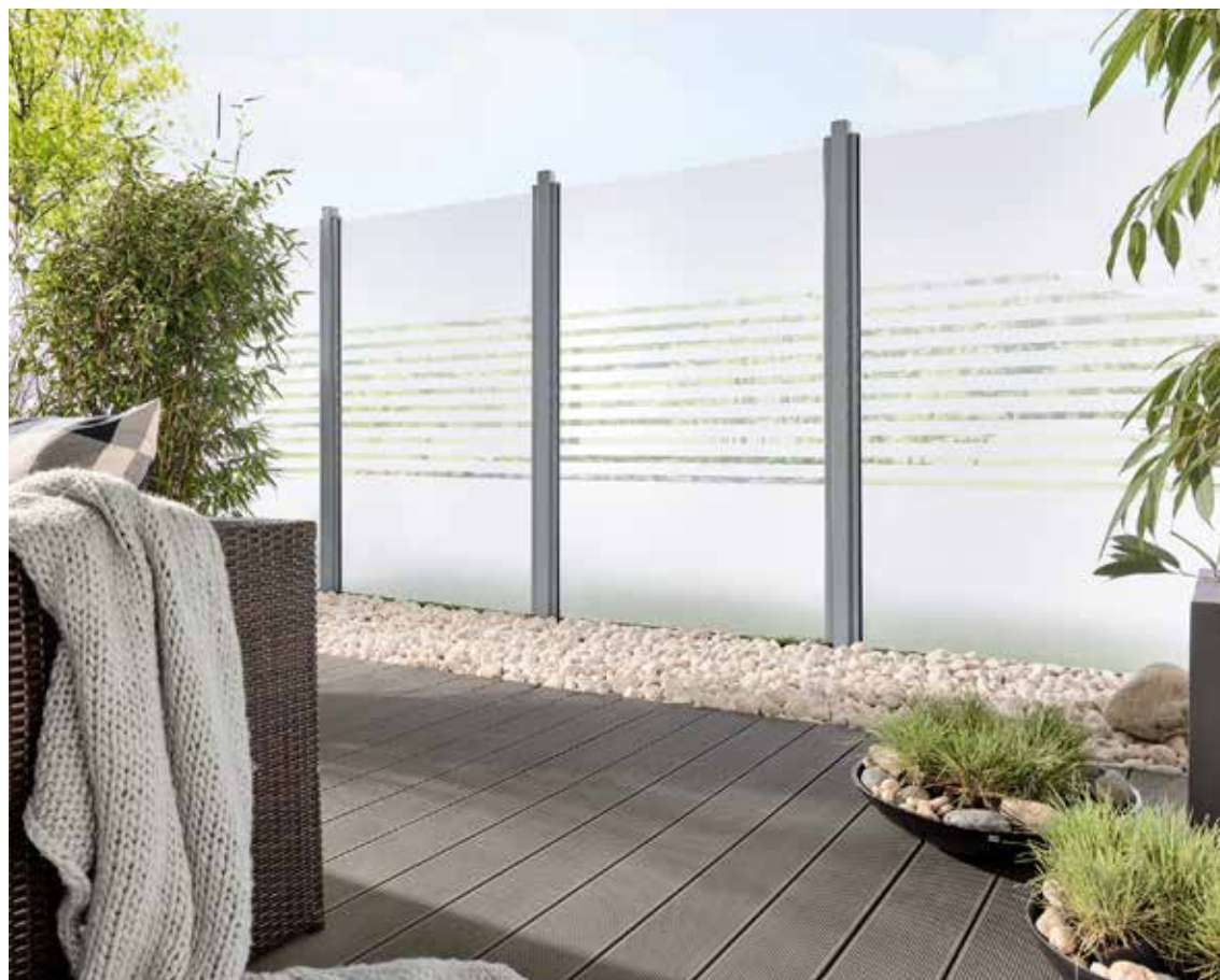
Für die neue Outdoorsaison: Sichtschutzzäune können eine homogene Einheit mit dem Bodenbelag bilden oder aber als schicker Kontrast inszeniert werden.