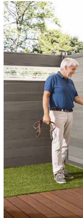
Ein strapazierfähiger Terrassenboden ist ...