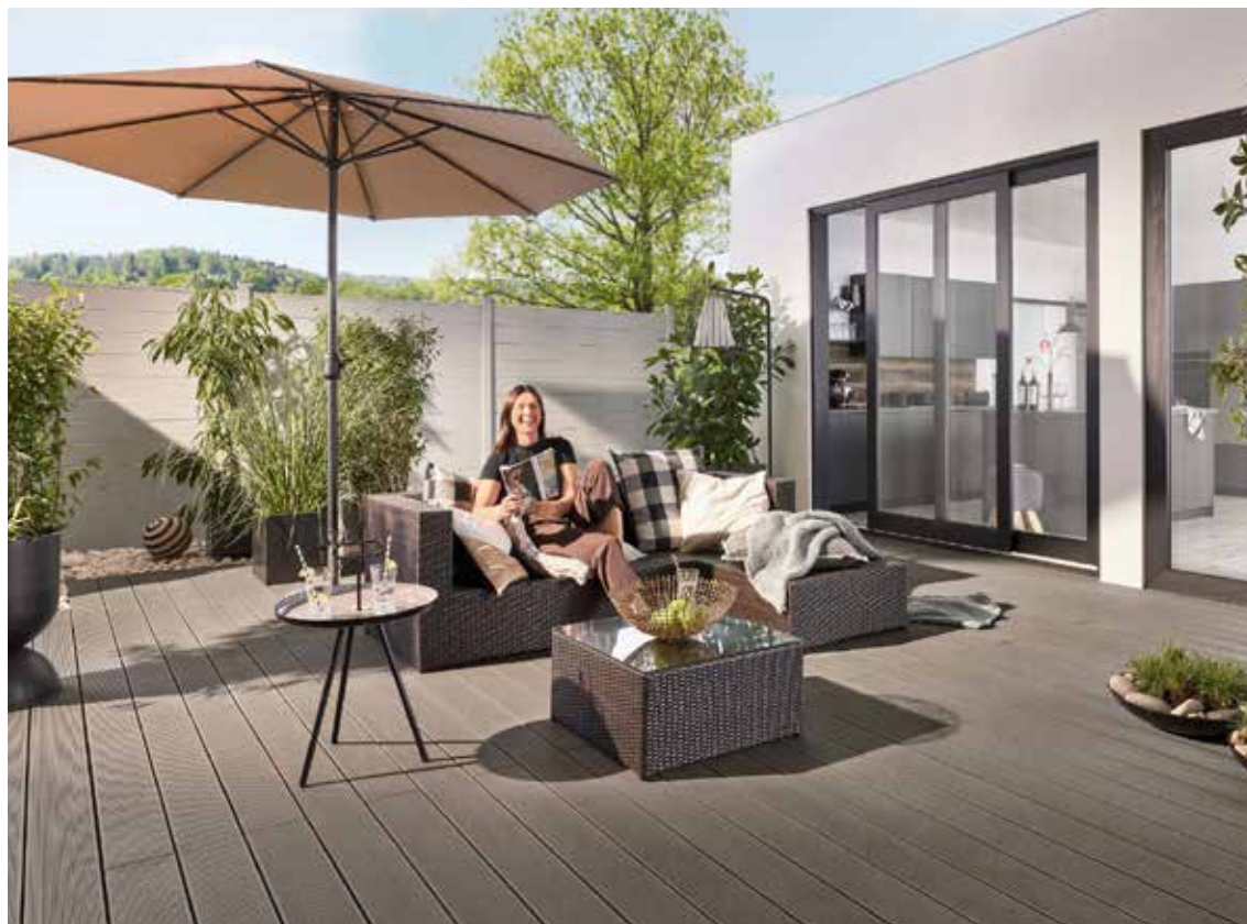
Grau gestaltete Gartenwelten wirken zeitlos und elegant. Im Trend liegen aktuell Grautöne wie Hellgrau, Silbergrau, Titangrau und Anthrazit.