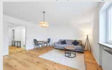
Verbrauchsausweis, 122 kWh, Bj., 1965, Öl

Bezugsfreies und Möbliertes 1-Zimmer-Apartment