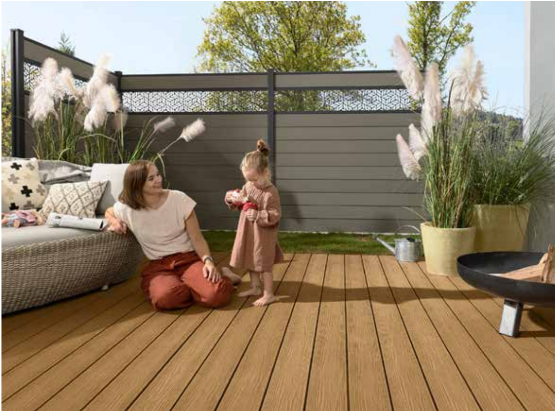
Terrassendielen in Holzoptik stehen weit oben auf der Beliebtheitskala. Sie bringen Gemütlichkeit und Naturnähe des nachwachsenden Rohstoffs mit sich.

Bodenbelag und Sichtschutz zählen zu den Basics einer Terrassengestaltung. Da sie an 365 Tagen im Jahr der Witterung schonungslos ausgesetzt sind und so mancher Herausforderung von Grillfest bis Planschbecken-Party standhalten müssen, sind langlebige und strapazierfähige Lösungen gefragt. Echtholzdielen sind dank ihrer unvergleichlichen Optik und Haptik nach wie vor ein absoluter Klassiker.