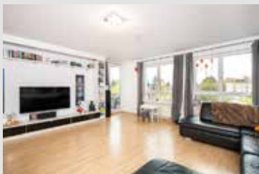
Verbrauchsausweis, 81 kWh/(m²a), Bj. 1996, Erdgas

Große 3,5-Zimmer-Wohnung mit separatem Home-Office-Bereich in ruhiger Lage