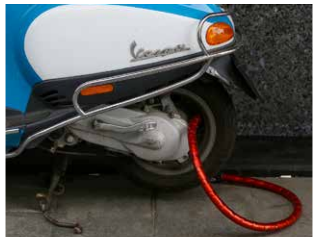
„Aufgrund ihrer leichten Bauweise sind Mopeds relativ einfach zu stehlen“, so der Kfz.-Experte Rainer Grim von der R+V. Die Gründe liegen für ihn auf der Hand.

Sind Fahrerinnen oder Fahrer der kleinen Flitzer im Straßenverkehr in einen Unfall verwickelt, dann hat dies teils gravierendere Folgen – denn Mopeds erreichen eine Höchstgeschwindigkeit von immerhin 45 Kilometern in der Stunde. Die kompakten Zweiräder haben keinerlei Knautschzone und die Fahrerinnen und Fahrer tragen