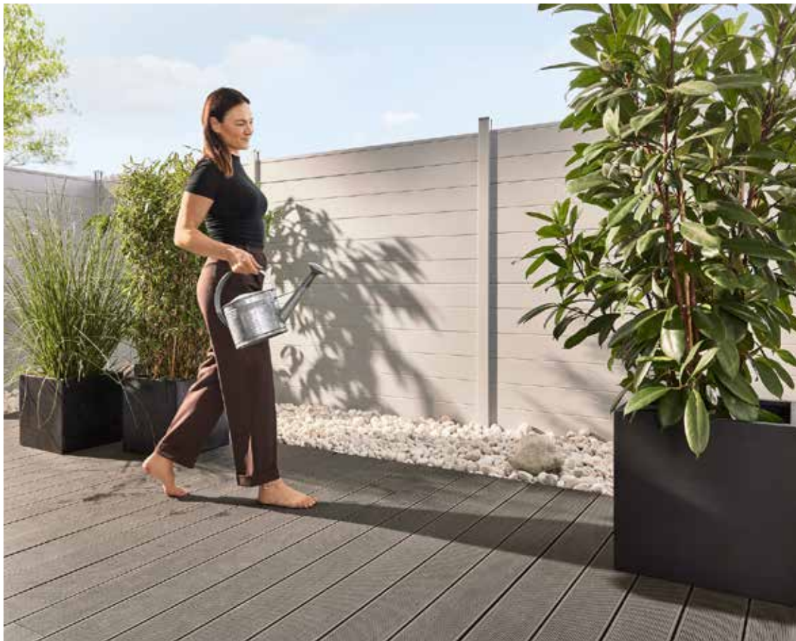
Moderne Terrassendielen verwandeln den Außenbereich in ein Wohlfühlparadies und sind deutlich langlebiger als das hölzerne Original.

Moderne Hersteller setzen hier u. a. auf nordische Kiefer, welche 2-fach imprägniert und mit Leinöl gegen Wind und Wetter geschützt wird. Auch Dielen aus Massivbambus – wahlweise mineralveredelt oder thermobehandelt – sowie spezielle Thermohölzer wissen ihre Vorteile gekonnt auszuspielen. Wer den Instandhaltungsaufwand auf ein Minimum reduzieren möchte, greift zu den alternativen Terrassendielen in Holzoptik. Neben authentischen Holzdekoren liegen hier aktuell vor allem Grautöne wie Hellgrau, Silbergrau, Titan-