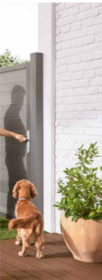
... robust und das A+O für Hundebesitzer.