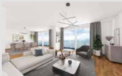
Heizung (Fernwärme), Wohngeld 460,- €/mtl., bezugsfrei nach Absprache Verbrauchsausweis: 142 kWh/(m²a), Bj. 1969, Fernwärme

Großzügige 2-Zimmer-Wohnung mit potential auf 3 Zimmer direkt am Ostpark