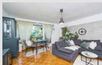
(inkl. Garage), mtl. Wohngeld 285,-€ (inkl. Rücklagen), momentan vermietet Verbrauchsausweis: 124,24 kWh/(m²a), Bj 2013 Erdgas

Gepflegte 2-Zimmer-Wohnung in idyllischer Lage